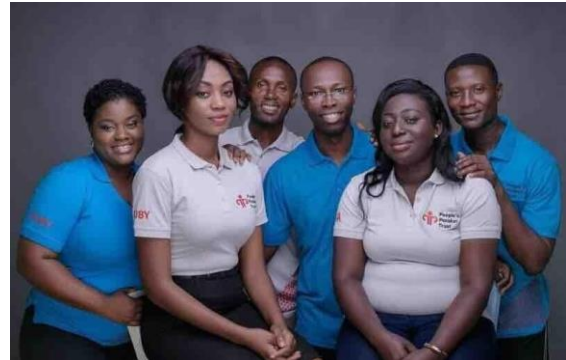
Het team van People’s Pension Trust Ghana

te beantwoorden. Geld inleggen kan contant, via mobiele betalingen of per bank. Het product wordt verkocht via bestaande groepen, zoals spaargroepen, vakbonden en boerencoöperaties. De verlening van de vergunning leverde veel publiciteit op. Samuel Waterberg, CEO van People’s Pension Trust, gaf verschillende radio- en tv-interviews.